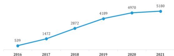
Circulante de la Sala Segunda 2016-2021

Claramente puede observarse como se ha ido incrementando el circulante año con año mostrando una variación hacia el alza desde el año 2017, situación que como se ha comentado, es producto de la entrada en vigor de la Reforma Procesal Laboral.